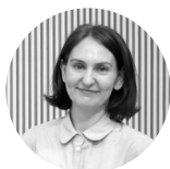
Helen Legg, directrice de la Tate Liverpool

Face à la pluralité des contextes dans lesquels il agit, le 49 Nord 6 Est – Frac Lorraine se pose les questions suivantes: Comment sensibiliser à l'art lorsque les structures d'apprentissage les plus répandues s'appuient sur l'intellect et non sur le sensible ? Comment ne pas transformer l'œuvre d'art en outil didactique ? Et comment ne pas devenir une machine à occuper le temps libre ? Faire apparaître la diversité de la production artistique actuelle, mais aussi la diversité des regards sur l'art, est le choix fait par le 49 Nord 6 Est pour valoriser la diversité des sensibilités et l'enrichissement mutuel qui découle de leur rencontre.